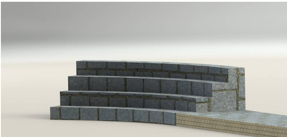
Ilustración 1( Modelo 3d del anfiteatro terminado después de la ejecución del presente proyecto)